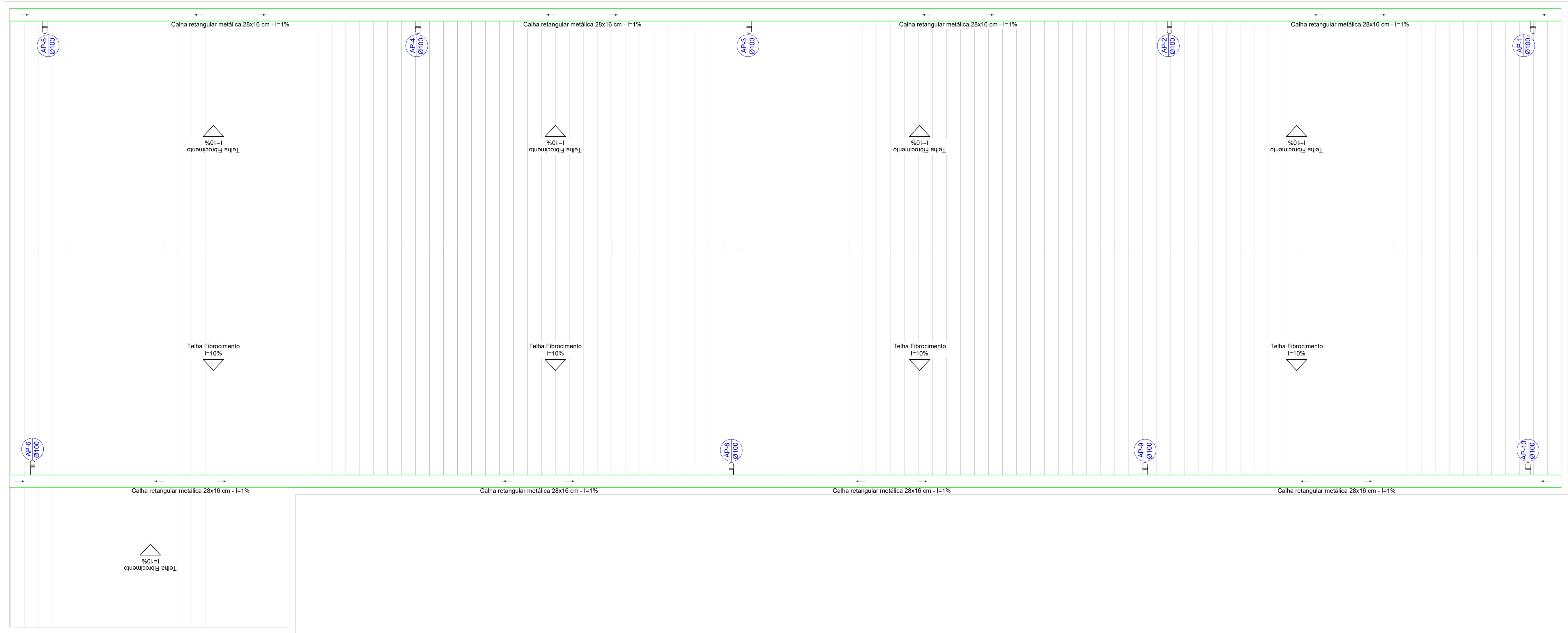
PLANTA BAIXA COBERTURA - UBS BAIRRO FAZENDA DO MATÃO ESCALA 1:50